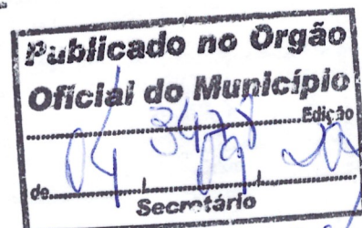
Ederson Fábio Pereira da Silva