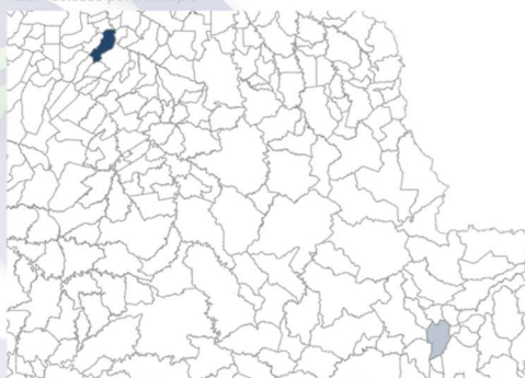
Valor Pactuado por Município

11 Qtde SIT 1.884.021,44 Valor Pactuado 1.571.578,21 Valor Repassado 1.167.150,11 Valor Despesa 1 Qtde Concedentes 7 Qtde Tomadores